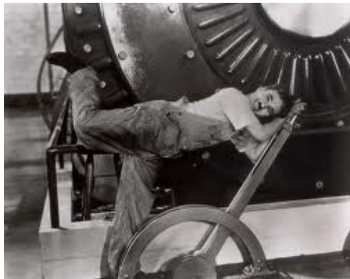
Charlie Chaplins Modern Times

Mit dieser Anspielung auf den dissonanten Eros der Technik, haben wir, was für den momentanen Stand der Dinge wunderbar genug ist, das genaue Abbild, das Imaginäre (um es mit den Worten Jacques Lacans auszudrücken) der Maschine in der Moderne, natürlich beginnend mit Charlie Chaplins Modern Times , wie wir es immer tun, ob wir uns nun dessen bewusst sind oder nicht (dies ist Teil unseres filmischen Unbewussten), selbst wenn wir den Film nicht gesehen haben sollten.