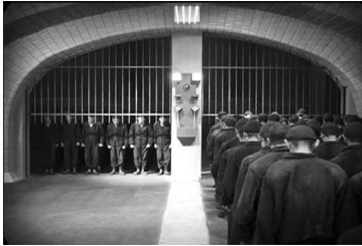
Fritz Lang, Metropolis

Gewiss würde es sich wahrscheinlich lohnen darüber nachzusinnen, ob denn diese dunkle Vision Langs nicht auch zumindest teilweise eine inspirative Wirkung auf die von Günther Anders so seltsam benannten Molussianer aus seinen lebenslangen Bemühungen um seinen Roman Die molussische Katakombe hatte, den Anders in den 1930er Jahren begann und den er bis 1992, dem Jahre seines Todes, nicht veröffentlichen konnte. 14