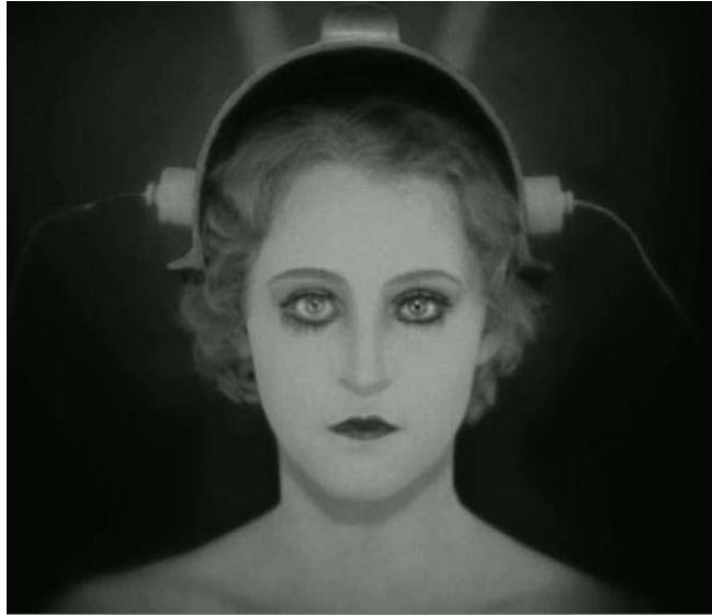
Birgitte Helm als Robot

Programmierung funktioniert, und angenommen wir stimmen der Programmierung zu, wobei die fügsame Zustimmung der Nutzer, und das sollte besonders hervorgehoben werden, zufällig die andere Hälfte des Programmierungserfolgs ist — für die technologische Errungenschaft als solche halten. 15 Dies funktioniert, Turing Liebhaber mögen dies zur Kenntnis nehmen, in beide Richtungen.